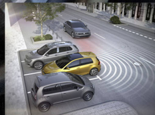
Hỗ trợ tiến/lùi vào chỗ đỗ xe vuông góc

**Các tính năng chỉ có trên phiên bản Luxury**