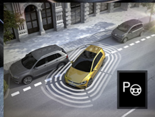
Hỗ trợ tiến/lùi vào chỗ đỗ xe song song